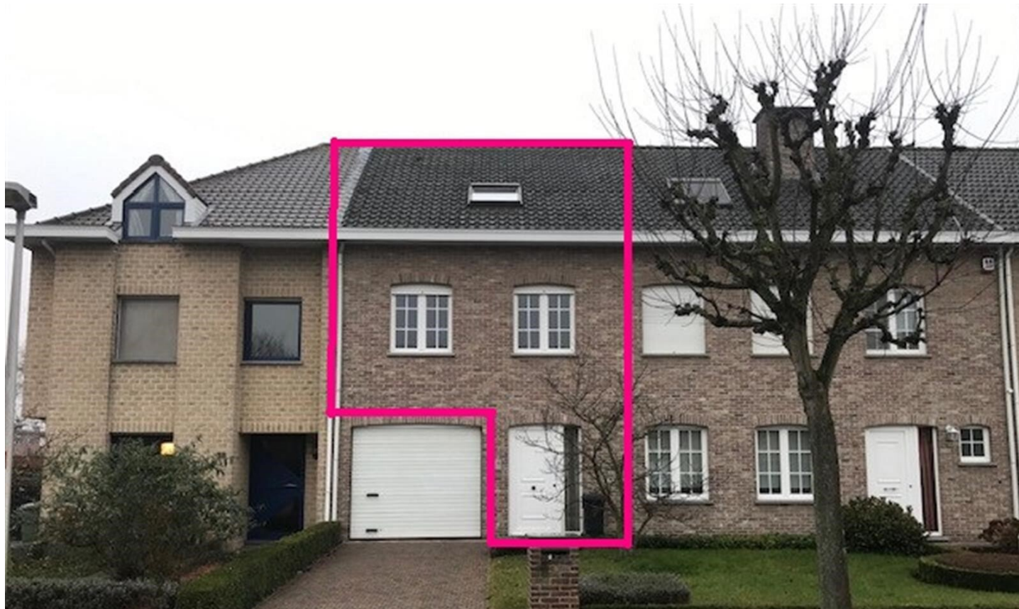
Kapellen | Appartement | € 785

Sint-Dionysiusstraat 16, 2950 Kapellen | Referentie: 24196-AC